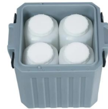
TP5 C - PASSIV 4 x 5