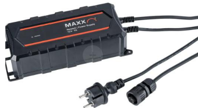
Netzteil 7A IP65