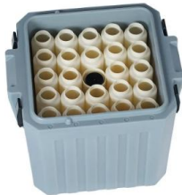
TP5 C - PASSIV 24 x 1