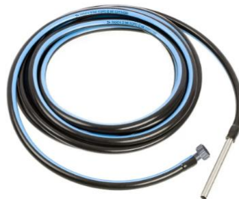
Saugschlauch 5m (10mm)