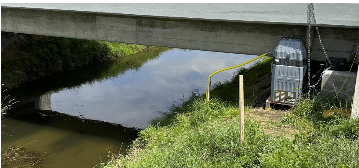
Messkampagnen am Fließgewässer mit Akkuversorgung