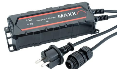
Ladegerät 2A IP65