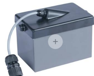
Ersatzakku 12V 10Ah