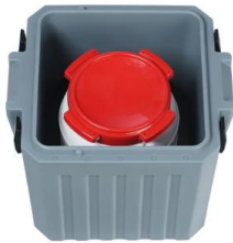
TP5 C - PASSIV 1 x 10

24 x 1 l Flaschen (Glas – Duran50) (über Verteilerplatte)