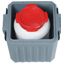
TP5 C - PASSIV 1 x 25